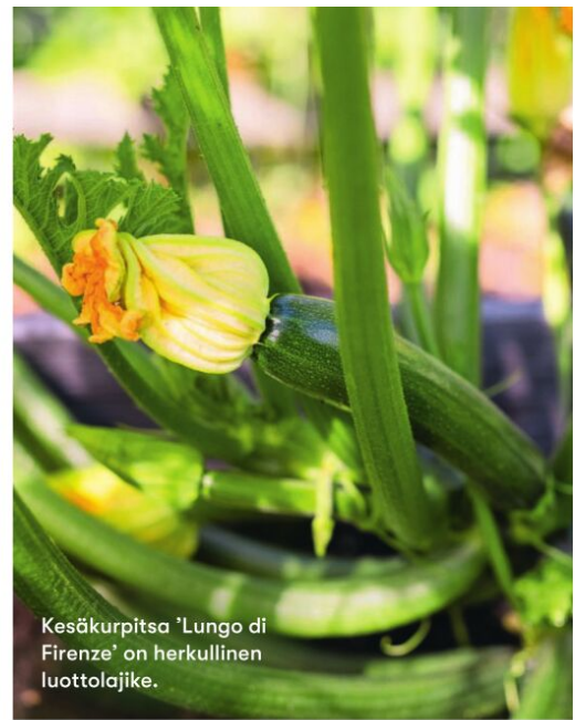
Kesäkurpitsa 'Lungo di Firenze' on herkullinen luottolajike.

Siperianlehtikuusi on kymmeniä vuosia vanha.